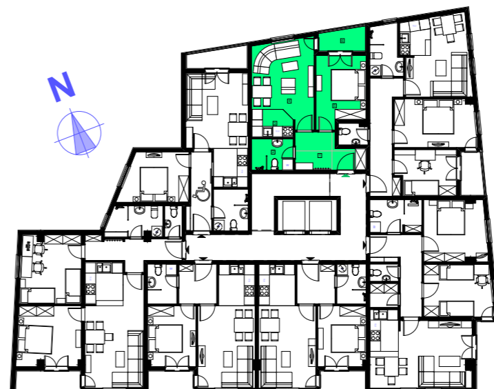
POZICIJA STANA NA ETAŽI